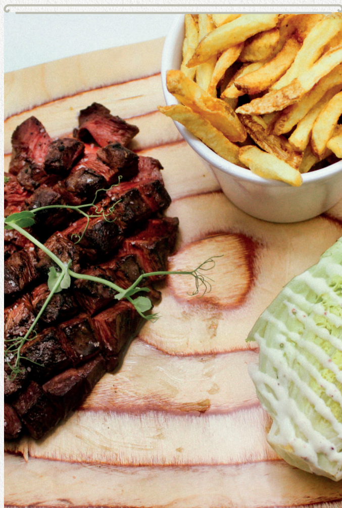
Magret de canard quadrillé