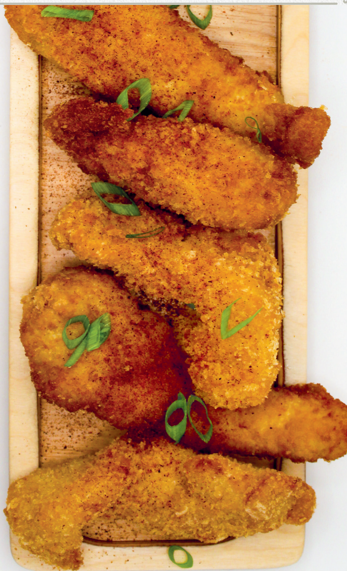
Dips de Poulet panés maison