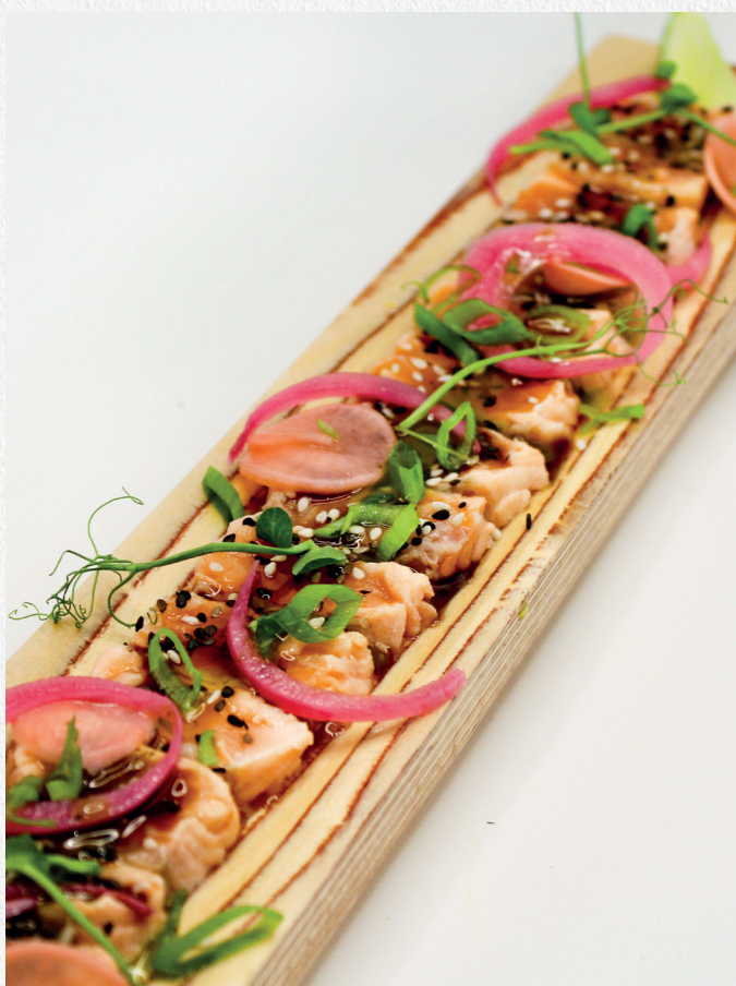
Tataki de saumon sauce teriyaki