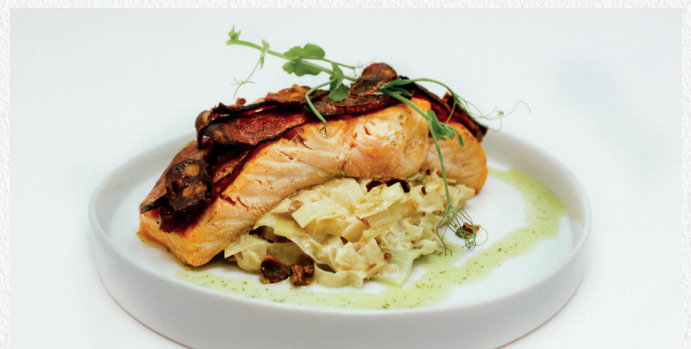
Pavé de saumon & Chips de bacon