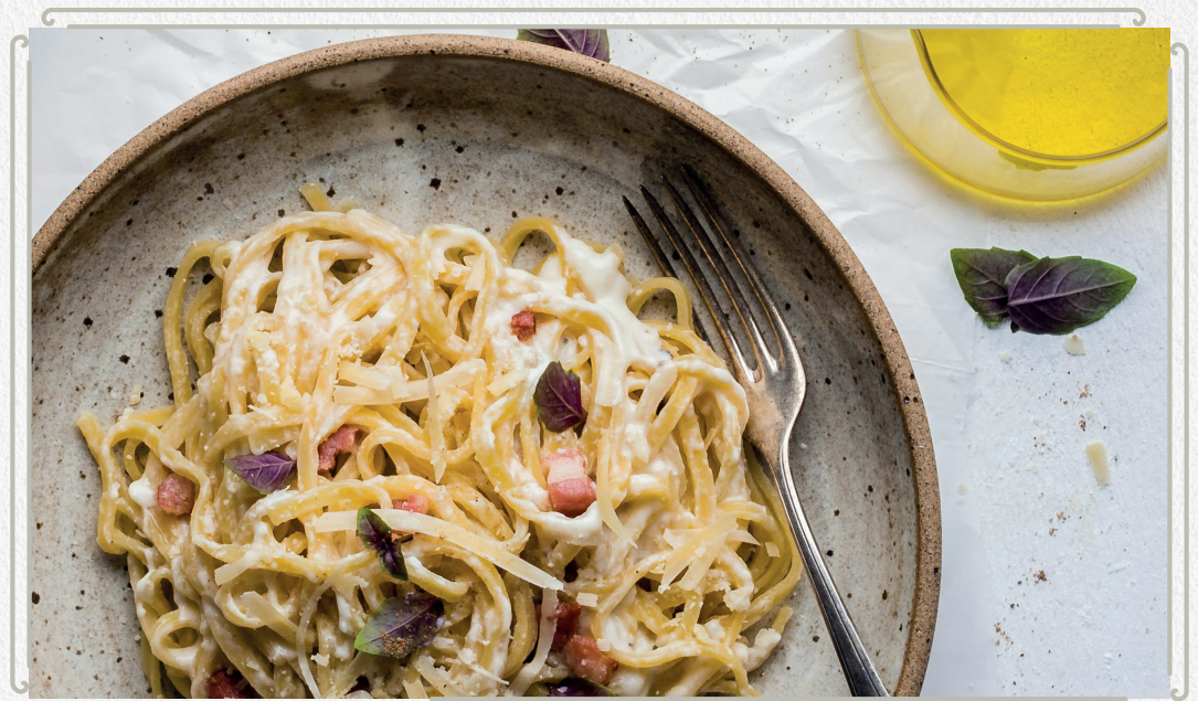
Exemple de pâtes de la semaine - Toucan

Chaque jour est une découverte avec un plat différent, une recette de pâtes renouvelée chaque semaine, et une pièce du boucher qui évolue régulièrement selon arrivage.