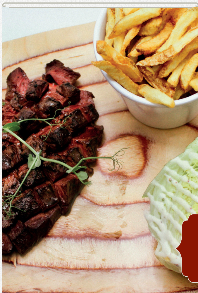
Magret de canard quadrillé