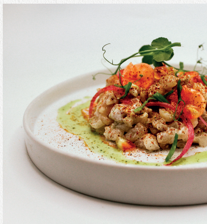
Ceviche de lieu