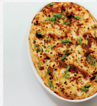
Lasagnes au saumon