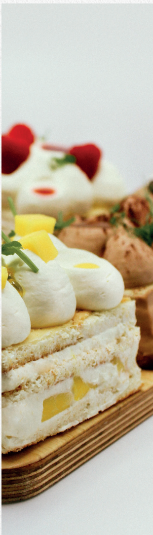
Dessert de notre chef pâtissier