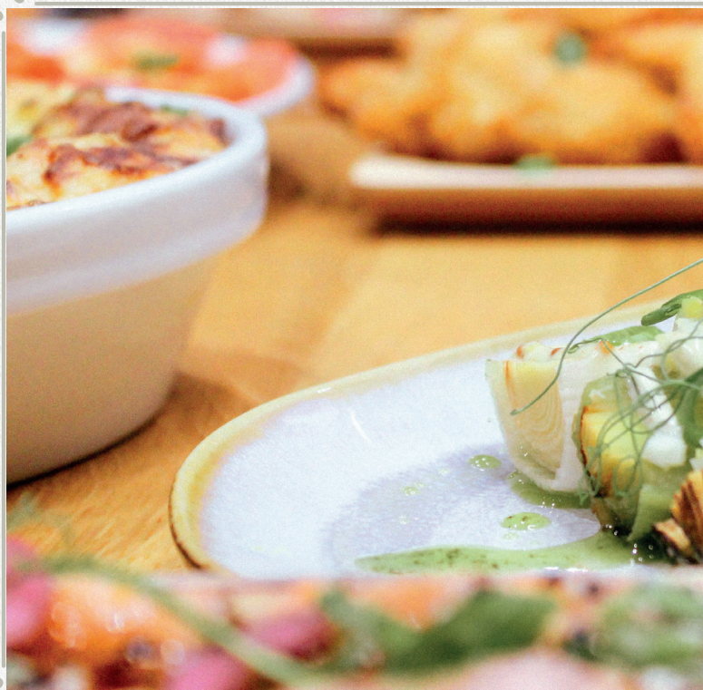
Poireaux vinaigrette et œuf mimosa