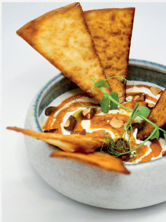
Stracciatella au pesto rosso