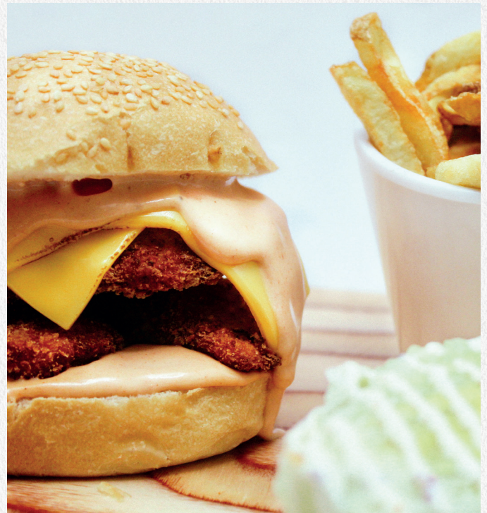
Burger Poulet 100 % Maison